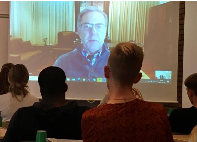
Samhällsfrågor vävs ihop med naturvetenskaplig tillämpning och elevernas engelska slipas lite extra vid videomötet.

Professor Cloete från universitetet i Stellenbosch, Sydafrika, skickar med ett tydligt budskap till eleverna på Natur Tvär vid årets Skypemöte: vikten av att arbeta i grupp och tillvarata varandras infallsvinklar och olika sätt att angripa problem. Då eleverna i Natur Tvär-ettan just börjat sin utbildning i projektform framhöll han hur olika synsätt tillsammans med respekt kan bidra positivt till arbetet i en grupp.